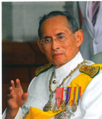
Thaise koning Bhumibol: sinds 1946

De Italiaanse toneelschrijver Dario Fo (90) overleed donderdag 13 oktober. In 1997 kreeg hij de Nobel-